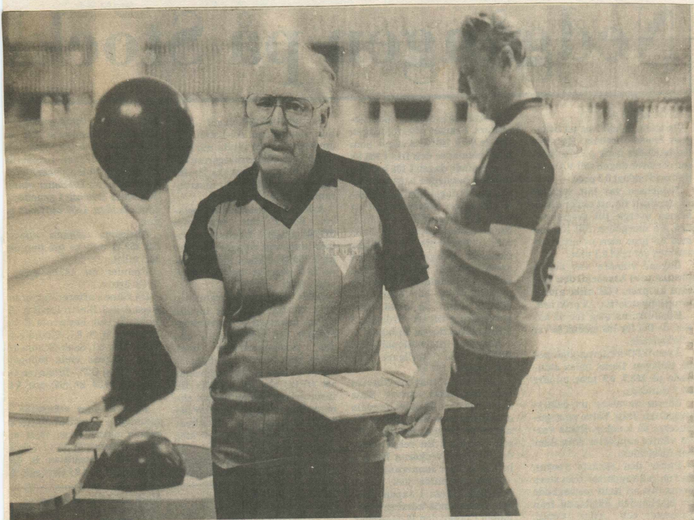
KFUM började bäst i Karlskrona-derbyt i bowling, men fick till slut ge sig mot ett starkt spurtande IFK Karlskrona.