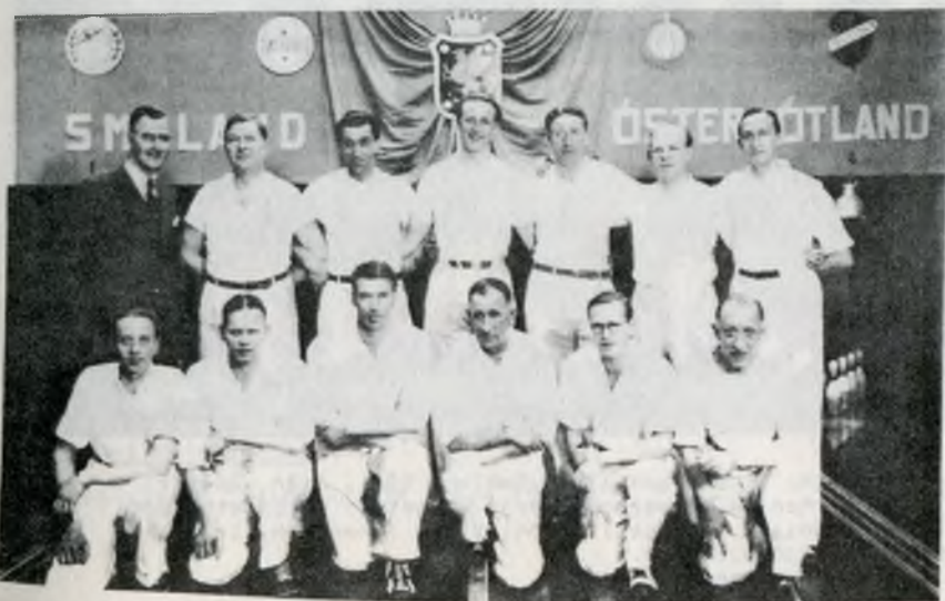
Smålandslaget i Linköping 1944, Östergötland - Småland.